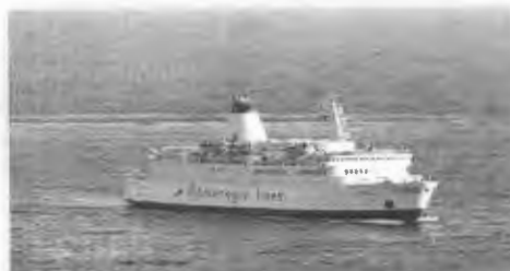
Slika 3 - Brod Sveti Stefan II