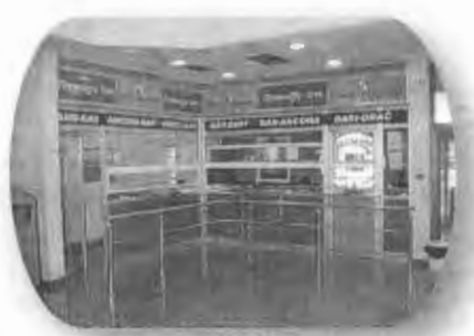
Slika 2 - Putnička Agencija