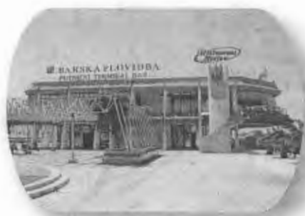
Slika 1 - Putnički terminal