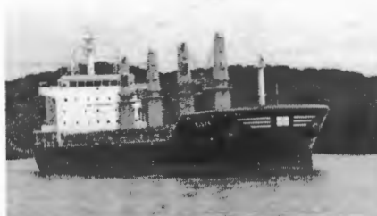
Slika 5. Brod Budva