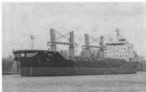
Slika 4. Brod Bar